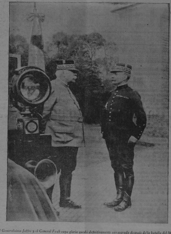
El Generalísimo Joffre y el General Foch cuya gloria quedó definitivamente consagrada después de la batalla del Marne

El contrafuerte de Broys en el Sur de la meseta, tiene como equivalente en la parte meridional, pedían comédicos, desde el castillo se domina la depresión de terreno formada por las ciénagas de Saint-Gond. Sus altas murallas no. Me soraja mejor que nos vayamos a perder en la gran batalla.