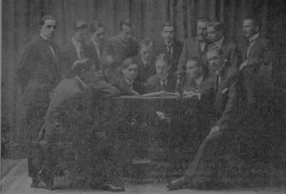
Retomamos aquí la fotografía de los estimulados jóvenes de esta sociedad, socios fundadores del Jokey Club...